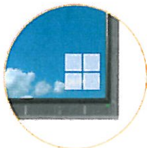
piktogram informující o blížícím vypnutí analogového vysílání

Zemské analogové TV vysílání z vysílačů Barvičova a Hády bude 30. září 2010 ukončeno. Na většině územní oblasti Brno město tak nebude od října možné „přes anténu“ přijímat analogově žádný televizní program. Na blížící se termín vypnutí analogových vysílačů budou diváci, kteří signál příslušných vysílačů přijímají, upozorněni zobrazením piktogramu se čtyřmi čtverečky, informační lištou a spoty .